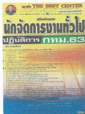
หนังสือคู่มือเตรียมสอบนักจัดการงานทั่วไป ปฏิบัติการ กทม.๖๓ โดย สถาบัน The Best Center