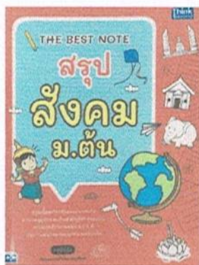
หนังสือ สรุปสังคม ม.ต้น โดย IDC Premier