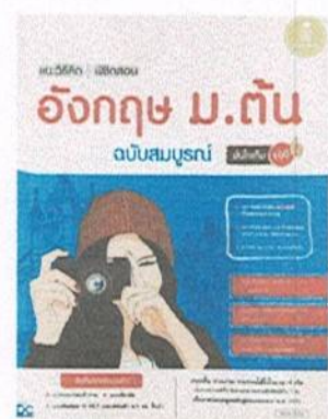
หนังสือ แนววิธิตัด พิชิตสอบ อังกฤษ มัธยมต้น โดย สิริพันธ์ ภิญโญ