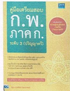
หนังสือคู่มือเตรียมสอบ ก.พ. ภาค ก. ระดับ ๓ (ปริญญาตรี)โดย IDC Premier