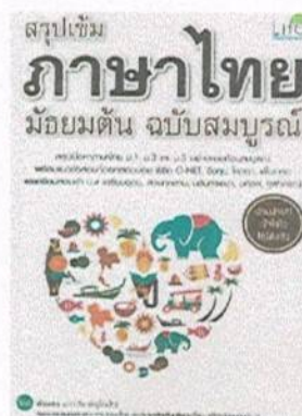
หนังสือ สรุปเข้มภาษาไทย มัธยมต้น ฉบับสมบูรณ์ โดย พิชชธร ปะทะวัง