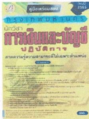
หนังสือ คู่มือเตรียมสอบ กรุงเทพมหานคร นักวิชาการการเงิน และบัญชีปฏิบัติการ โดย สถาบัน The Best Center)